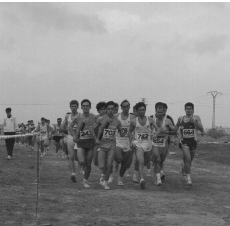
CROSS DE CATARROJA. Temporada 93-94