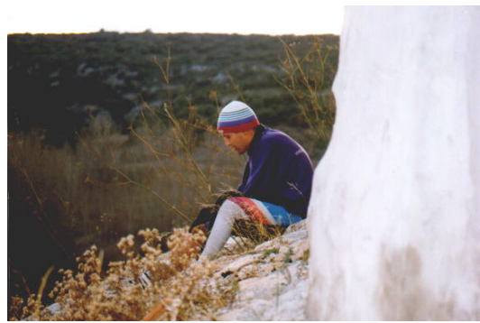
El sufrimiento es para todos por igual . . .