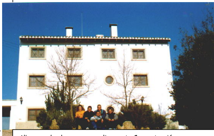
Albergue donde vamos a realizar esta Concentración. CASA MEDINA - UTIEL