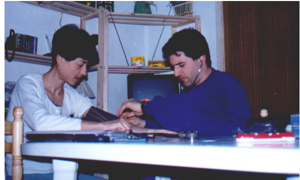
Estamos cubiertos por un amplio equipo de doctores y médicos que saben lo que hacen