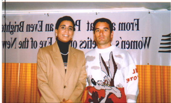
NAWAL EL MOUTAWAKEL (MAR.) OLIMPIC CHAMPION 400v. '84 (Campeona Olímpica)

FIONA MAY (GBR-ITA) 7'11 m. LONG JUMP 2 nd M.M. Mundial '98