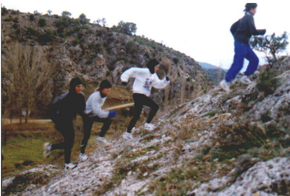
En los entrenamientos no hay tiempo para la relajación i El ultimo pechuga i